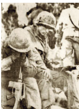
Varios soldados descansan luego de una dura confrontación en Vietnam del Sur.