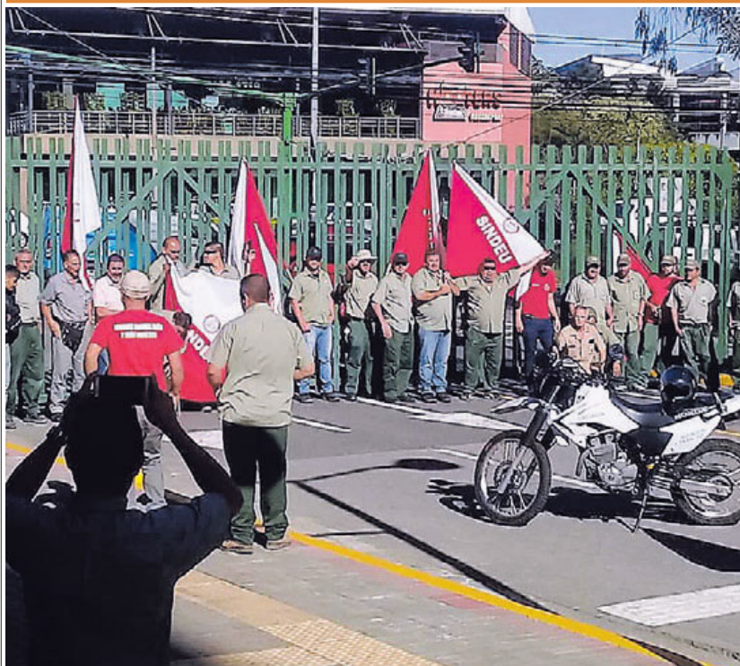
Integrantes del Sindicato mantenían cerradas las entradas a la Ciudad Universitaria de San Pedro de Montes de Oca. También hubo paros y cierres de oficinas en las sedes de San Ramón y Liberia.

ADMINISTRACIÓN Y SINDICATO NEGOCIAN PORCENTAJE DE ANUALIDAD