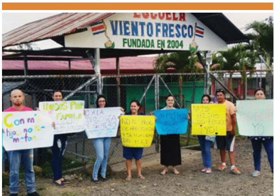
Como protesta, varios padres cerraron, el jueves pasado, centros en San Carlos, como la Escuela de Viento Fresco. EDGAR CHINCHILLA

Ese mismo día, el alto Tribunal reiteró que isla Calero es en su totalidad de Costa Rica, salvo la laguna Los Portillos (Harbor Head) y su playa, que son territorio de Nicaragua. ■