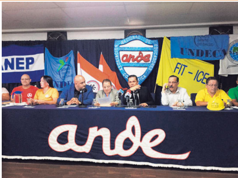
Sindicatos del sector público realizaron, el pasado 13 de abril, un llamado a la huelga de hoy, para mostrar su oposición a la reforma fiscal propuesta por el Gobierno.