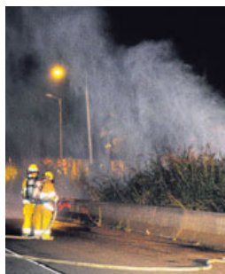
Fuga de combustible en oleoducto de Recope. RAFAEL MURILLO

Como medida de atención, Recope cerró las válvulas del poliducto. Este sistema atraviesa todo el país. ■