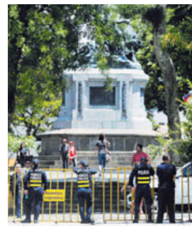
49 de 51 legisladores votaron en favor de dar apoyo absoluto a la Fuerza Pública. DIANA MÉNDEZ

"En estos últimos días, nuestro país ha estado sometido a una situación convulsa, cuyo pararrayos ha sido nuestra Fuerza Pública, hombres y mujeres de azul que han pue-