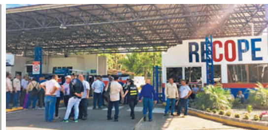
Empleados de Recope en las instalaciones en Moín.