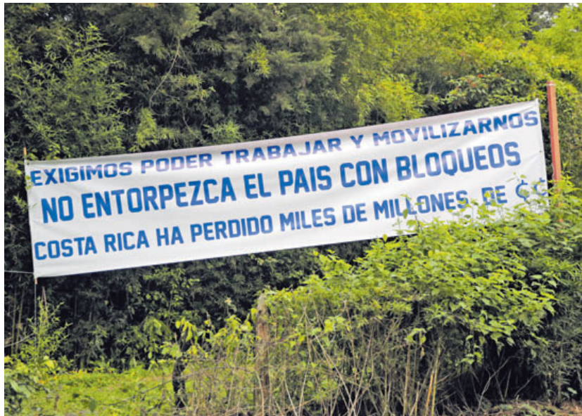
El jueves, en la Escuela Social Juan XXIII, en Dulce Nombre de La Unión, Cartago, este cartel recibió a las delegaciones en la segunda reunión entre sindicatos y Gobierno por la reforma fiscal. JEFFREY ZAMORA

“Señores huelguistas, ustedes tienen su salario asegurado. Yo necesito trabajar y su bloqueo no me deja”, se leía en su cartel, cuando ya los bloqueos en la zona habían ahu-