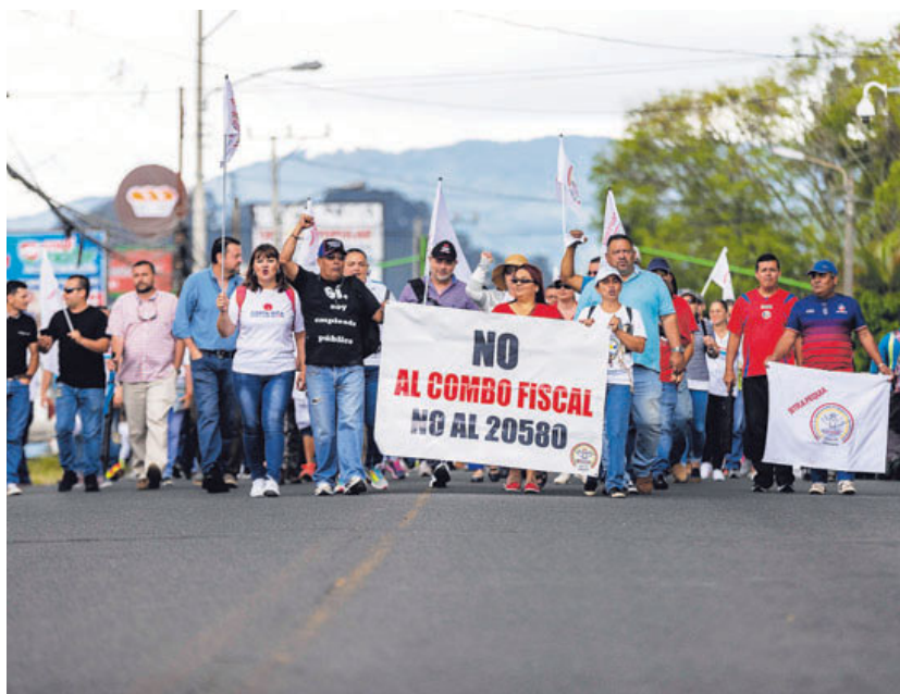
Las manifestaciones contra el plan fiscal que se encuentra en la corriente legislativa fueron la tónica en diversas partes del país durante esta segunda semana de huelga. JOSÉ CORDERO

“Las marchas son las (medidas de presión) menos disruptivas. La gente va caminando por un lugar, obviamente