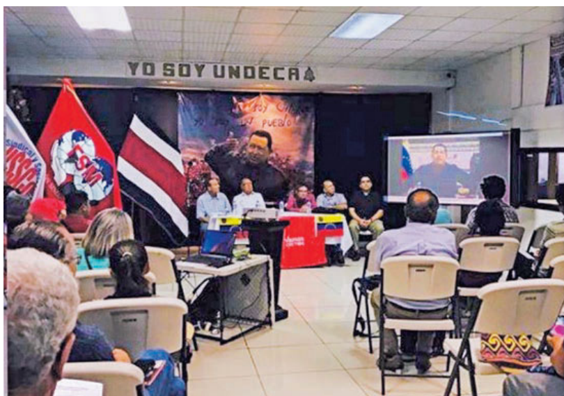
El 8 de diciembre de 2018, la Embajada de Venezuela en Costa Rica publicó esta imagen en Instagram sobre una actividad política realizada en Undeca. CAPTURA DE PANTALLA

REPRESENTANTES DE NICARAGUA Y CUBA PARTICIPARON EN ACTOS POLÍTICOS