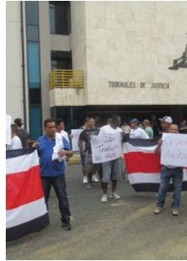
Exempleados de Dole se manifestaron frente a los Tribunales de Justicia. RAÚL CASCANTE

Los representantes del Sindicato Industrial de Trabajadores Agrícolas, Trans-