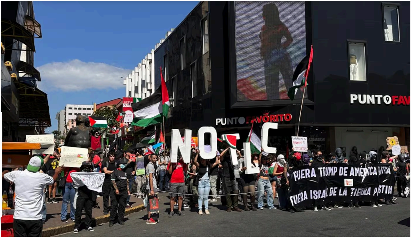
Manifestantes en favor de Palestina marcharon por San José.

Organizaciones en favor de Palestina se manifestaron este viernes en San José, mientras se realizaba el traspaso de poderes entre Rodrigo Chaves y Laura Fernández, en la Sabana.