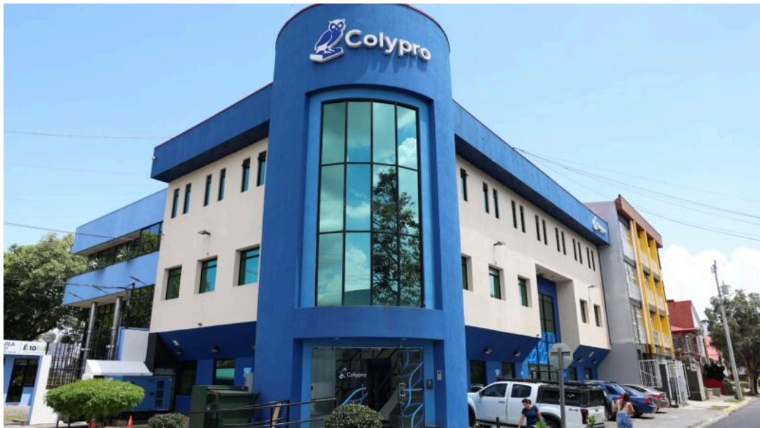
El órgano colegiado presentó un estudio. • Mauricio Aguilar